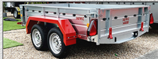
Version «S» double essieux Ridelles Galva., hauteur 40cm