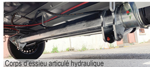
Corps d'essieu articulé hydraulique