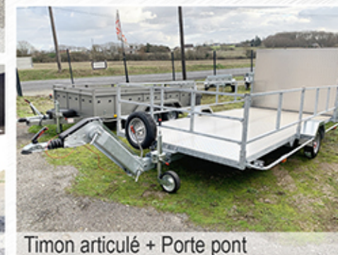
Timon articulé + Porte pont