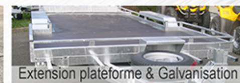
Extension plateforme & Galvanisation