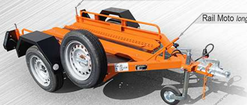
Rail Moto longueur 2m10