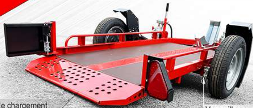
Becquet de chargement De série sur la version abaissable