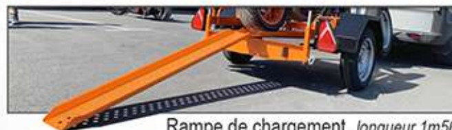
Rampe de chargement, longueur 1m56 Hauteur de chargement : 0m38