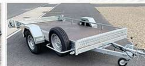
Galvanisation + Roue de secours