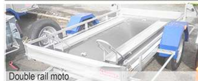
Double rail moto