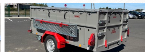
Rehausse support rampes... (S700Pro)