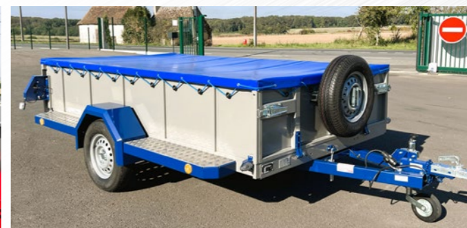
Structure marche pied, bâche, roue secours (S700Pro)