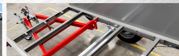
Un châssis selon nos exigences (SPro)