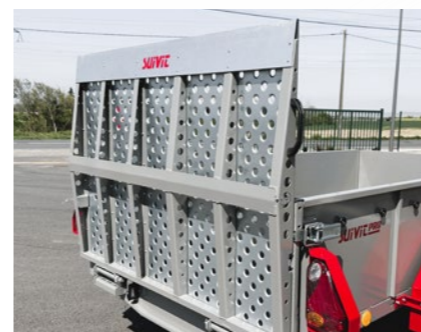
Porte-Pont 80cm (S600Pro)

* : valeurs pouvant varier suivant dimensions et options souscrites, X : Non disponible, SF : Sans Frein, AF : Avec Frein, S : Seuil chargement