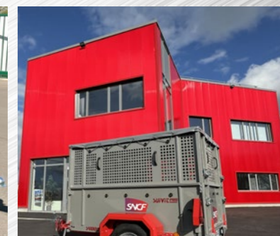
Rehausse, bâche... (S400Pro)