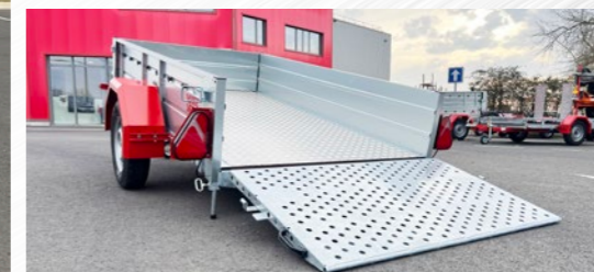
Plancher Alu, porte-pont, sign. LED (S600)