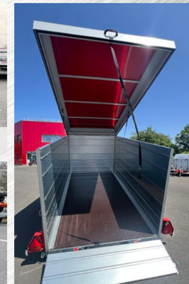
Rehausse & capot alu. (S700)