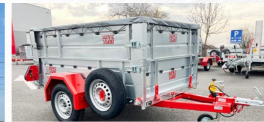
Rehausse, bâche plate, roue secours (S500)