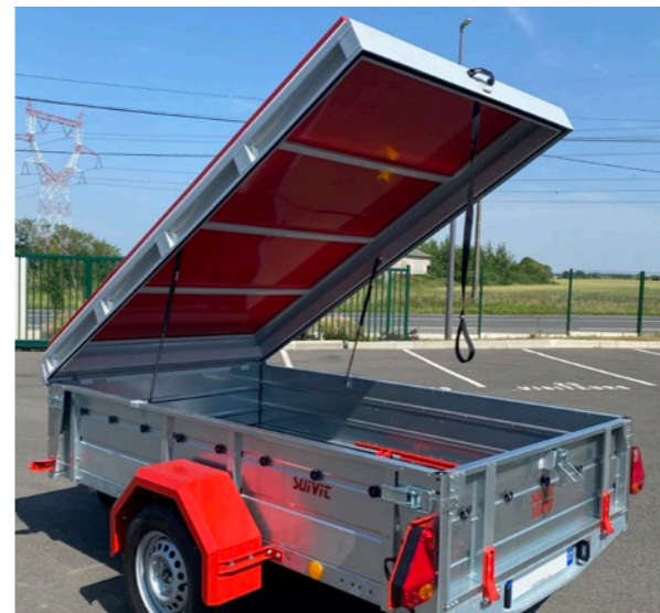
Capot Aluminium avec assistance au levage (S500)

* : valeurs pouvant varier suivant dimensions et options souscrites, X : Non disponible, SF : Sans Frein, AF : Avec Frein, S : Seuil chargement