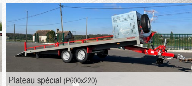
Plateau spécial (P600x220)