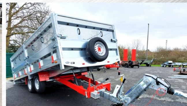
Timon articulé + basculant hyd, ridelles... (P500x200)