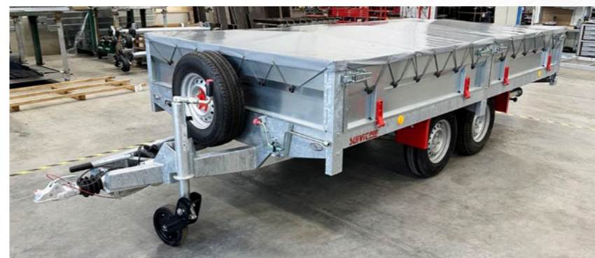
Full galva., ridelles, bâche plate & barre de soutien, rampe... (P400x200)