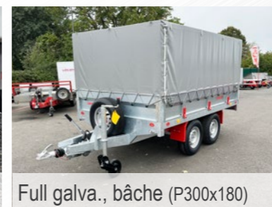
Full galva., bâche (P300x180)