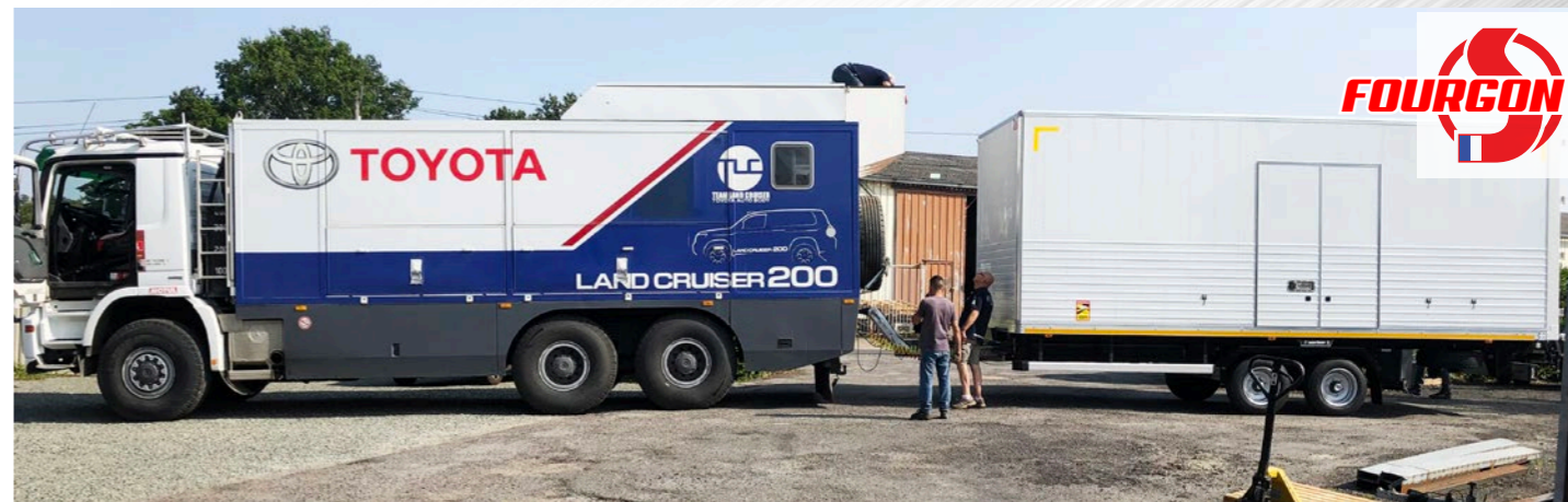
Remorque FOURGON, Dimensions, configurations, tarif : Nous consulter