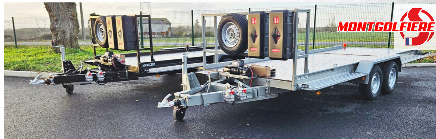
Remorque MONTGOLFIÈRE, Dimensions, configurations, tarif : Nous consulter

Et bien d'autres, il suffit de demander.