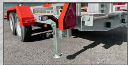
Béquilles de stabilisation arrière

S : Série, AF : Avec Frein, [R] : Remorque, [V] : Véhicule, tous nos tarifs s'expriment en HT