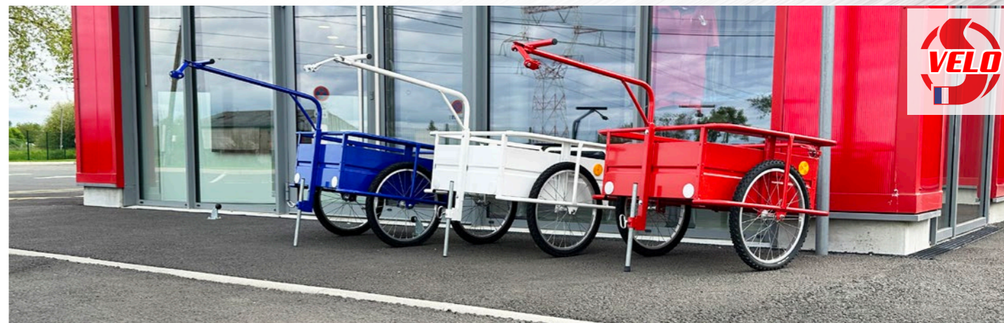
Remorque VÉLO, Dimensions 72 x 59cm, CU 75kg, tarif : 490€ TTC

* : valeurs pouvant varier suivant dimensions et options souscrites, AF : Avec Frein, S : Seuil chargement