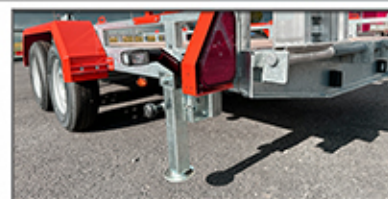
Béquilles de stabilisation Signalisation LED

S : Série, AF : Avec Frein, tous nos tarifs s'expriment en HT